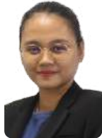
COMMELIE ELM LIE RISIP